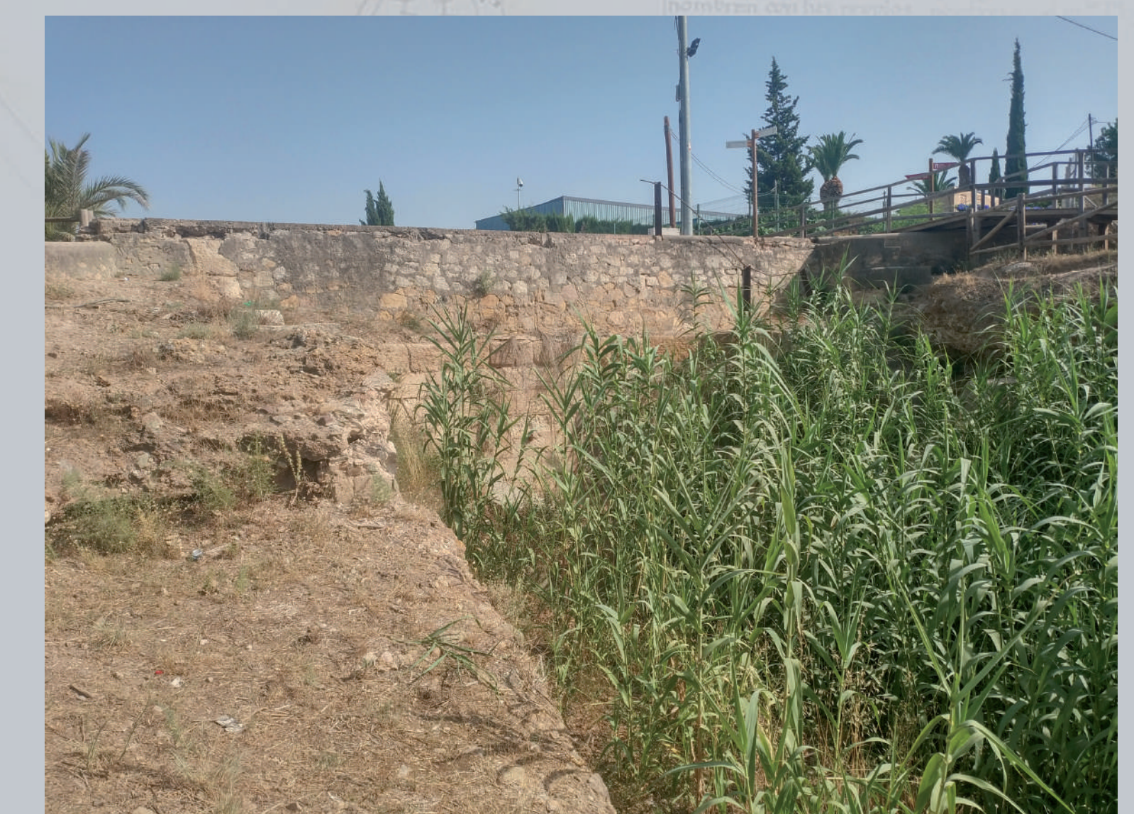
3 La antigua Contraparada era un punto de contención y desagüe de la acequia de la Aljufía. The old Contraparada was a place of contention and discharge of the Aljufía canal.