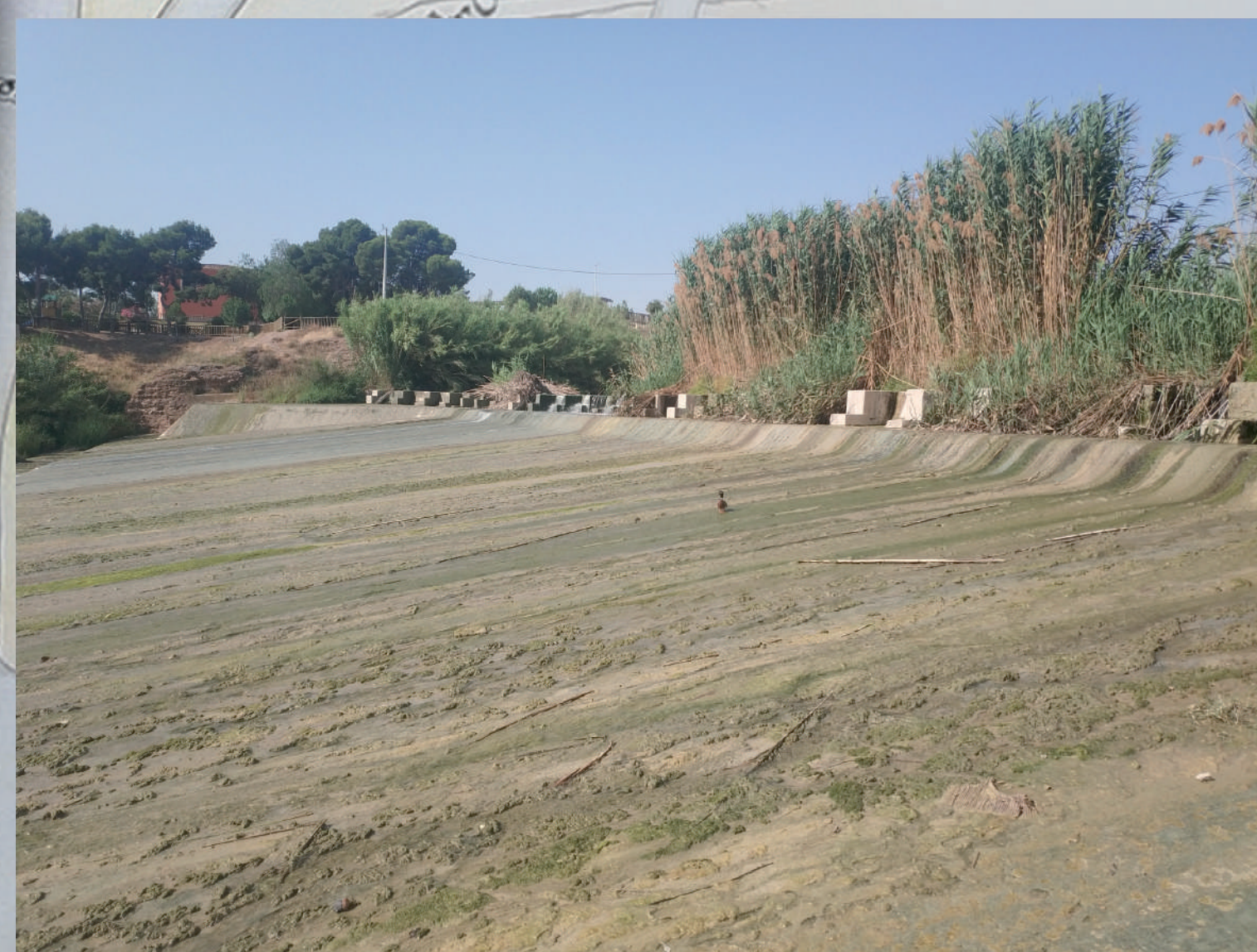
1 El Azud mayor o nuevo y el azud viejo forman lo que se conoce popularmente como Contraparada. The Azud Mayor or Azud Nuevo (new) and the Azud Viejo (old) form what today is commonly known as the Contraparada.