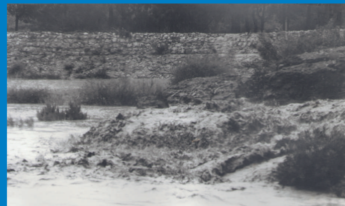
Fotos Antiguas. Inundaciones junto a la Contraparada Old Pictures. Floods next to Contraparada

El Ayuntamiento de Murcia ha realizado labores de limpieza y recuperación de esta obra de ingeniería hidráulica.