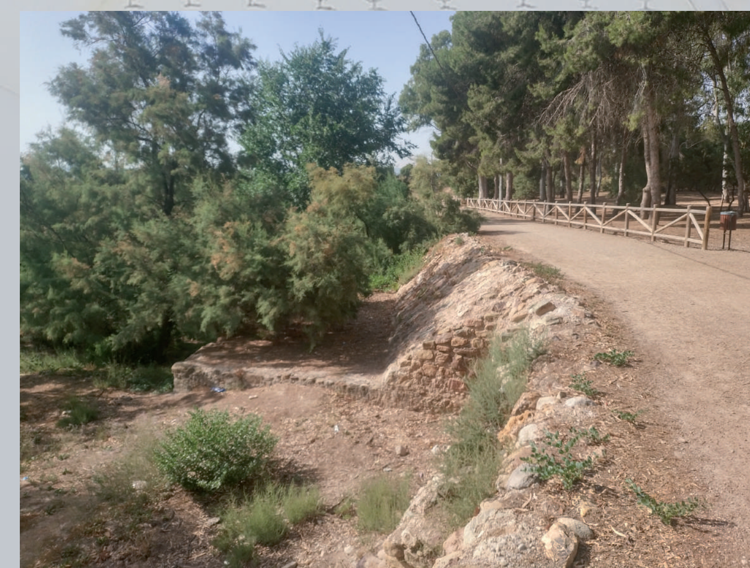
2 En esta estructura destaca el "zapatón", una zapata cuadrangular que funcionaba como contrafuerte. The 'zapatón' is what stands out in this structure; a quadrangular foundation that acted as a buttress.