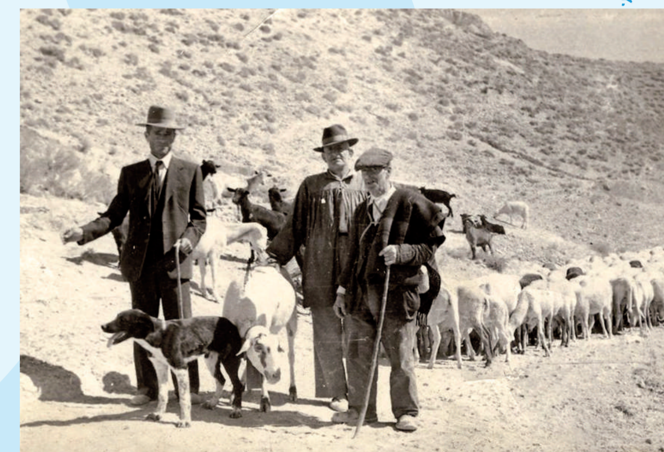
Transhumancia / Transhumance

— Calzada romana / Roman road — Cordel de los Valencianos